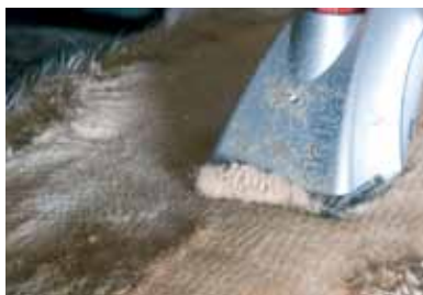
3 vitesses de tonte pour une tonte adaptée.

La tondeuse est livrée en coffret comprenant la tondeuse, un jeu de peignes 21 et 23 dents, un tournevis, un pinceau et une burette d'huile.